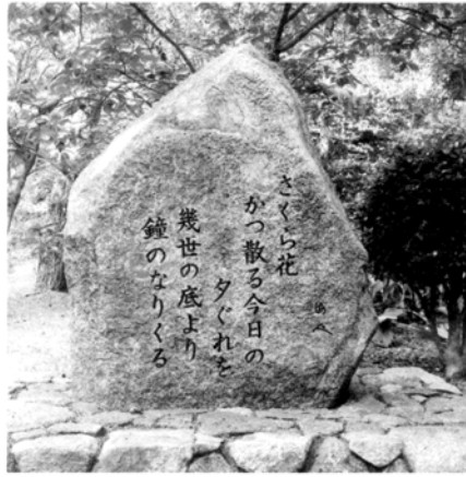
千本浜公園の海人歌碑